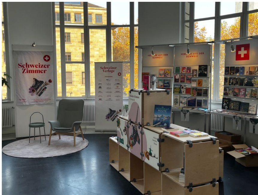
Schweizer Zimmer mit Sonderpräsentation „Fernweh“ auf den Stuttgarter Buchwochen 2025 II