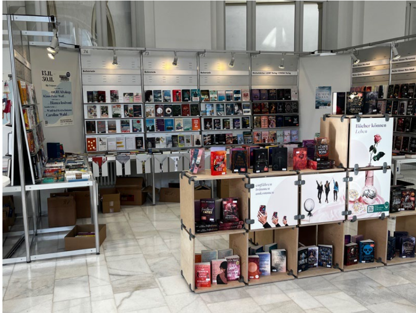
Sonderpräsentation „New Adult“ auf den Stuttgarter Buchwochen 2025 II