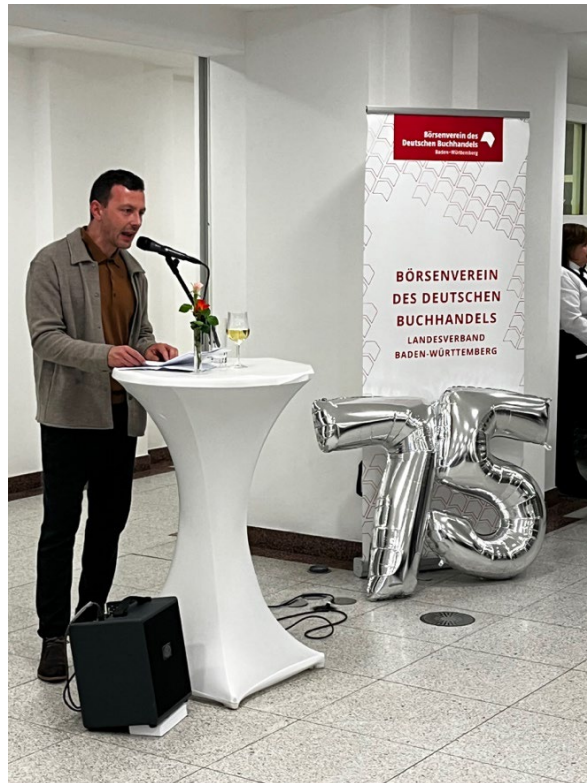
Sebastian Guggolz, Vorsteher des Börsenvereins, hält ein Grußwort zum Geburtstags-Aperitif der 75. Stuttgarter Buchwochen für die Mitglieder des Börsenvereins Baden-Württemberg II